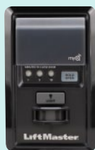
Panel de control MyQ (888LM)

Con la tecnología MyQ puedes mantenerte en contacto con tu hogar donde quiera que te encuentres mediante tu Smartphone, Tablet, Laptop o Computadora. MyQ te permite manejar, monitorear y controlar desde las luces de tu patio hasta el abridor de tu cochera y más Donde Sea-Quieras-Necesites