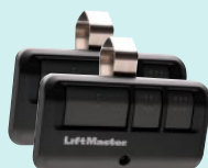
Control remoto MAX de 3 botones con tecnología Security+ 2.0 (893MAXLMK)