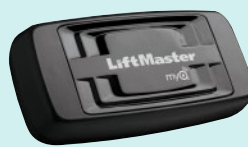
Gateway de Internet (828LM)